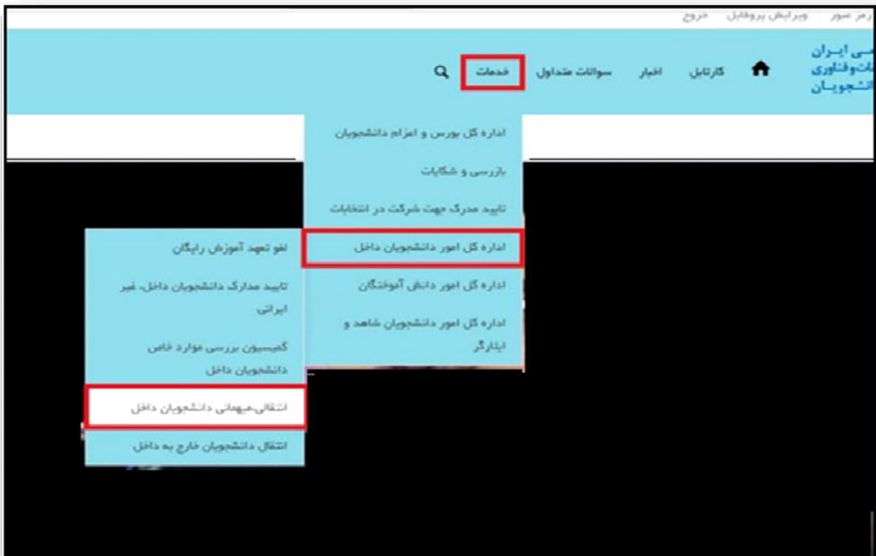
تصویر ۱-نمایش پورتال

توجه بفرمایید که متقاضی برای مشاهده این درخواست در منوی خدمات، باید حداقل یک مقطع تحصیلی کاردانی یا کارشناسی داخل کشور با وضعیت تحصیلی شاغل به تحصیل یا مرخصی تحصیلی (نوع دانشگاه) در پروفایل ثبت نام خود داشته باشد. در صورت عدم مشاهده این درخواست، پروفایل خود را از طریق گزینه ویرایش پروفایل، اصلاح نمایید و سپس از منوی خدمات به ثبت درخواست مربوطه بپردازید.